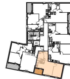
TABLEAU DES SURFACES HABITABLES

Architecte 1 quai Lamennais 35000 Rennes 02 99 77 97 02